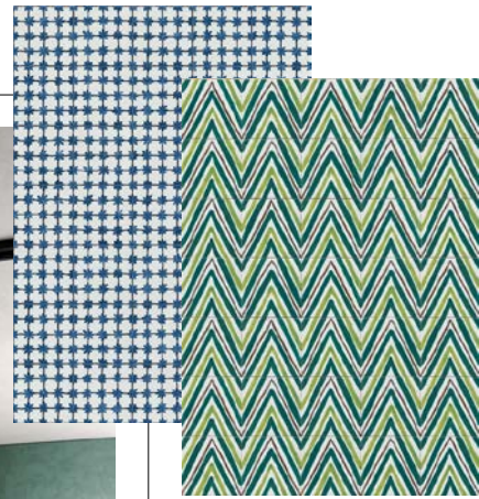
Gute Linien: Kollektion „Sol“, Feinsteinzeug, 15 x 15 cm, Preis auf Anfrage (Ragno)