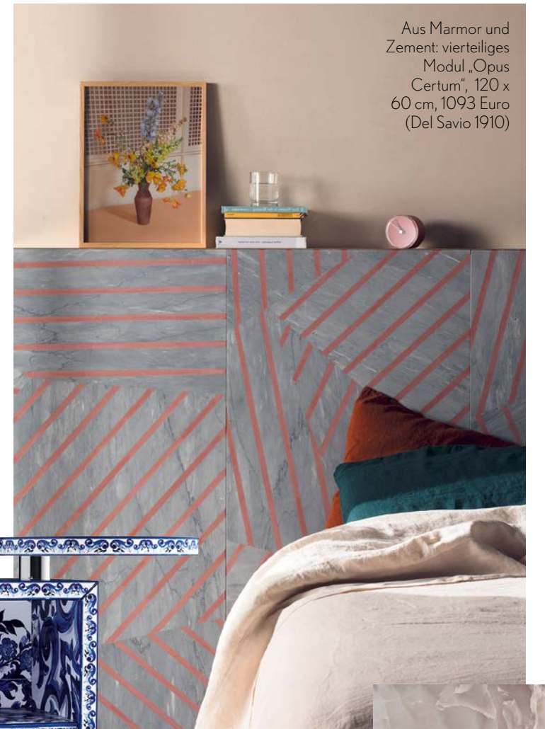
Aus Marmor und Zement: vierteiliges Modul „Opus Certum“, 120 x 60 cm, 1093 Euro (Del Savio 1910)