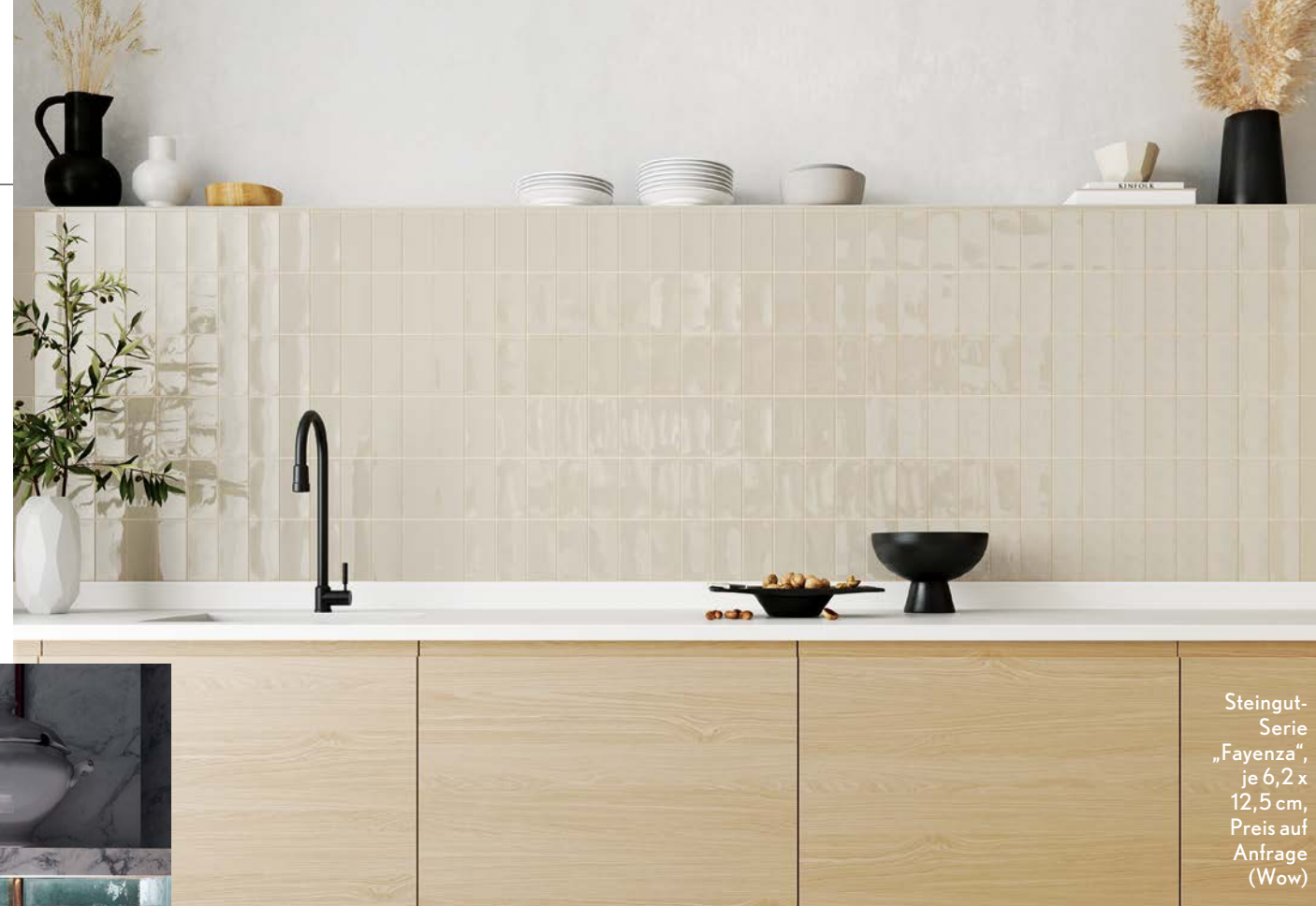
Steingut-Serie „Fayenza“, je 6,2 x 12,5 cm, Preis auf Anfrage (Wow)