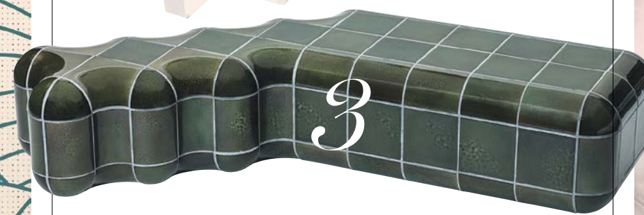
1 Beistelltisch „Caldas“, 713 Euro (Mambo). 2 Couchtisch „Trivia“ mit schwenkbarer Ablage, 12510 Euro (Dolce & Gabbana Casa). 3 Maßgefertigt: Bank „Working Tile by Max Lamb“, Preis nach Ausführung (Tajimi Custom Tiles)