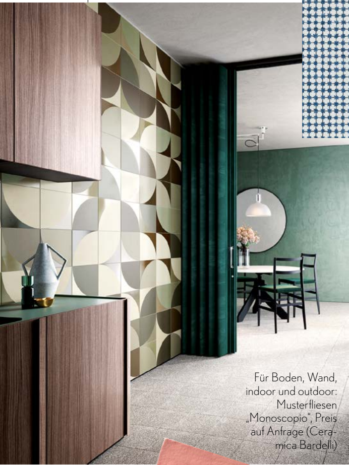
Für Boden, Wand, indoor und outdoor: Musterfliesen „Monoscopio“, Preis auf Anfrage (Ceramica Bardelli)